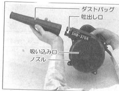
吹きとばし(ブロウ) 図2