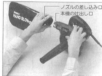
粉じんの集じん 図3